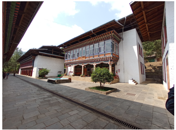
7 'U' k , Campus RUB