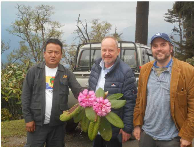
7 'U' k